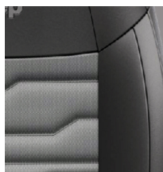
SZARA-CZARNA TKANINA Z WODOODPORNEGO I WYTRZYMAŁEGO MATERIAŁU OFF-ROAD PERFORMANCE