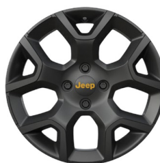
17" felgi aluminiowe lakierowane MATT BLACK z żółtymi akcentami