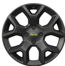
17" felgi aluminiowe lakierowane MATT BLACK z limonkowymi akcentami

■ wyposażenie standardowe – wyposażenie niedostępne