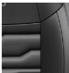
CZARNA SKÓRA Z SZARMI PRZESZYCIAMI