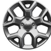
Aluminiowe obrycze kół 17" ALTITUDE (standard) LONGITUDE (opcja)