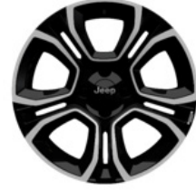
Aluminiowe obrycze kół 18" SUMMIT (standard) ALTITUDE (opcja)