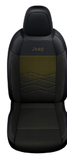
TKANINA ROBIN Z ŻÓŁTYM WYKOŃCZENIEM I WINYLOWYMI BOKAMI (OPCJA)