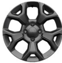
Aluminiowe obrycze kół 16" LONGITUDE (standard)