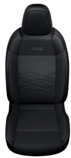
SZARA TKANINA ROBIN Z WINYLOWYMI BOKAMI