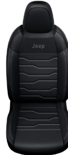
CZARNA SKÓRA Z SZARMI PRZESZYCIAMI (OPCJA)