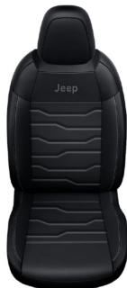
CZARNA SKÓRA Z SZARMI PRZESZYCIAMI (OPCJA)