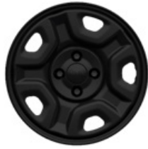
Stalowe obrycze kół 16" AVENGER (standard)

■ wyposażenie standardowe – wyposażenie niedostępne P Pakiet