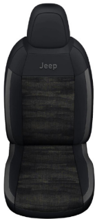
TKANINA DIGITAL JANE