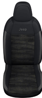
TKANINA DIGITAL JANE