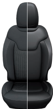
Tapicerka materiałowa / skórzana