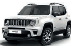
296 Biały Alpine (pastelowy)