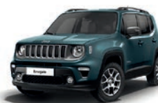
435 Niebieski Shade (metalizowany)