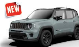
223 Matter Azue (metalizowany)