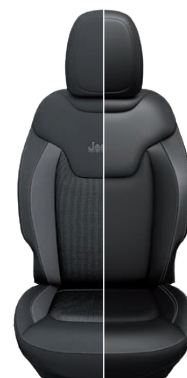
Tapicerka materiałowa / skórzana