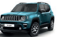
470 Bikini (metalizowany)