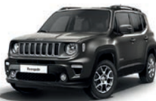
503 Sting Grey (pastelowy)