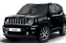
601 Czarny Solid (pastelowy)