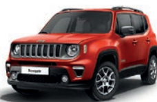
176 Czerwony Colorado (pastelowy)